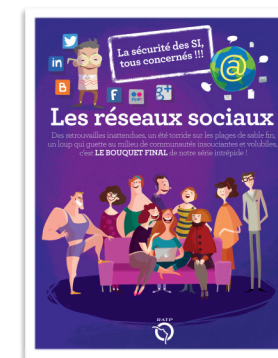
L'affiche du 2e épisode invite les salariés à se connecter pour le voir