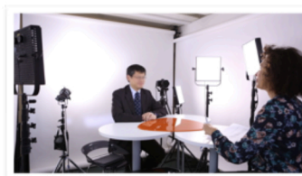
Contenus additionnels produits par l'entreprise ou proposés par Caribara (en option dans le dispositif) apportent une information approfondie sur le sujet