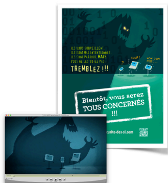
L'affiche teaser et le film teaser de la campagne interpellent et crée un phénomène d'attente sur le sujet