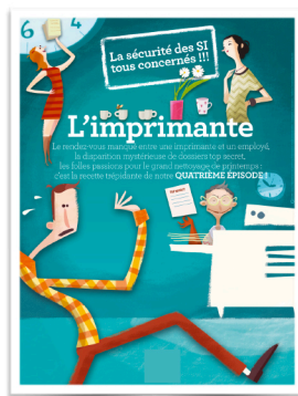
L'affiche du 1er épisode invite les salariés à se connecter pour le voir