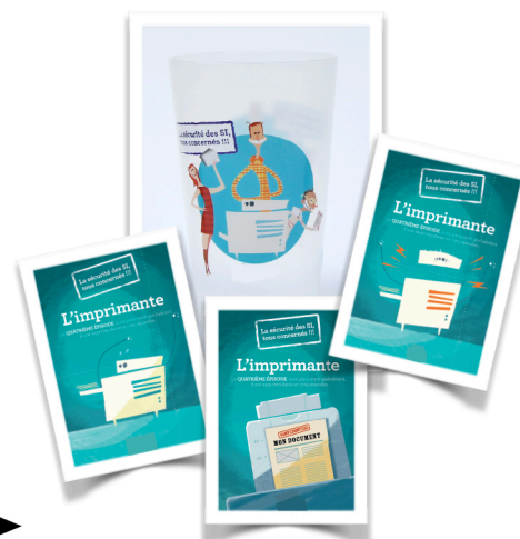
Cartes com et goodies sur la thématique de l'épisode pour faire vivre le message en dehors de l'intranet et entre 2 épisodes